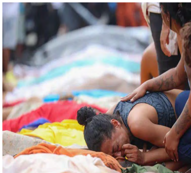
Angehörige beweinen Opfer des Massakers.

In ganz Brasilien gab es Proteste gegen die Verantwortlichen.