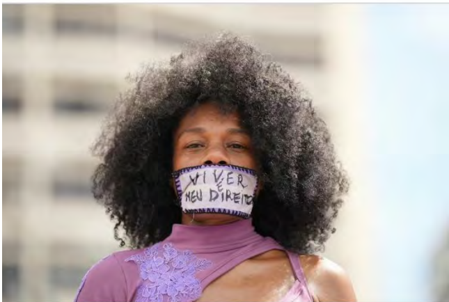
Leben ist mein Recht

Frauenmorde sind das Ergebnis einer gesellschaftlichen Struktur, die Machismo und Patriarchat als selbstverständlich hinnimmt. Die Täter glauben, Kontrolle über den Körper, das Leben und die persönlichen Entscheidungen der Frauen ausüben zu können. Die Zahlen sind erschreckend: Täglich werden in Brasilien vier Frauen aus geschlechtsspezifischen Motiven ermordet, was den kontinuierlichen Anstieg der Gewalt von Jahr zu Jahr verdeutlicht.