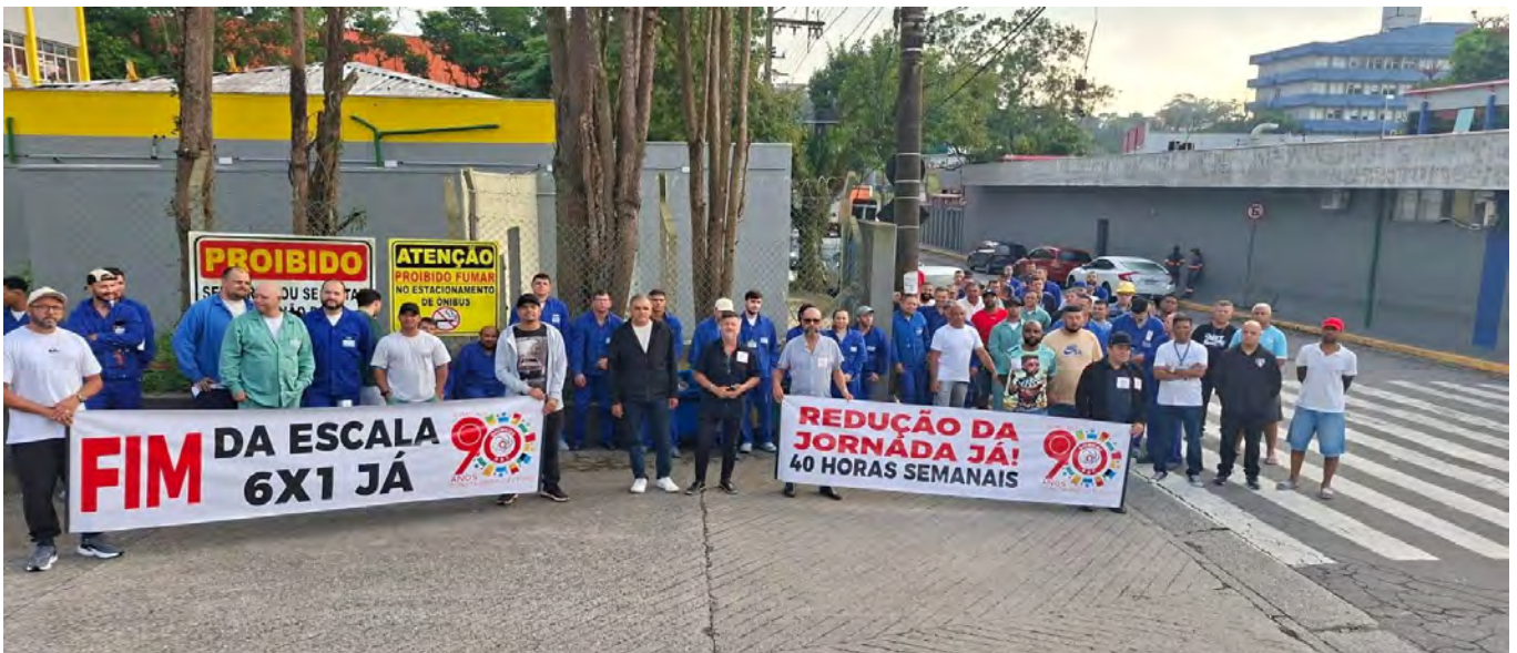
Kundgebung der Chemiegewerkschaft im ABC vor dem Werkstor bei Sherwin-Williams in São Bernardo do Campo